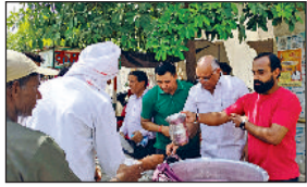
भिवानी। राहगीरों को मीठा पानी पिलाते हुए।