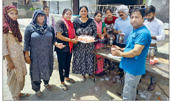
भिवानी। छबील लगाकर लोगों को पानी पिलाती वूमन हैलिंग सोसायटी की सदस्य।