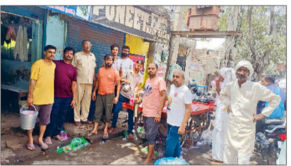
चरखी दादरी। राहगीरों व यात्रियों को मीठा पानी पिलाते व्यापारी।