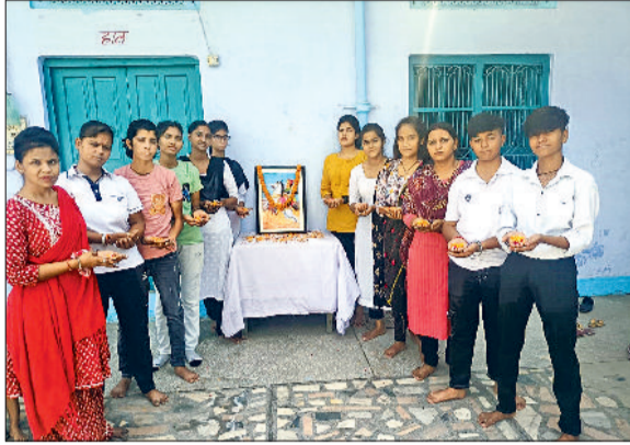
चरखी दादरी। झांसी की रानी लक्ष्मीबाई को श्रद्धांजलि देती झांसी की रानी एक प्रेरणा समूह व भारतीय प्रजापति हिरोज ऑर्गनाइजेशन की सदस्य।