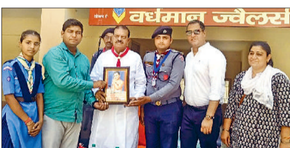
भिवानी। कार्यक्रम में मुख्यातिथि को सम्मानित करते हुए।