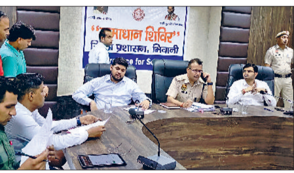
भिवानी। आयोजित बैठक में अधिकारियों को दिशा-निर्देश देते हुए।