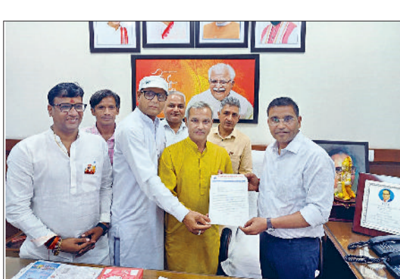
को अवगत करवाने के लिए शहर में उनकी प्रतिमा का होना बहुत जरूरी है। इसी कड़ी में नवदुर्गा सेवा