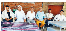
भिवानी। बैठक के दौरान चर्चा करते मोर्चा के पदाधिकारी।