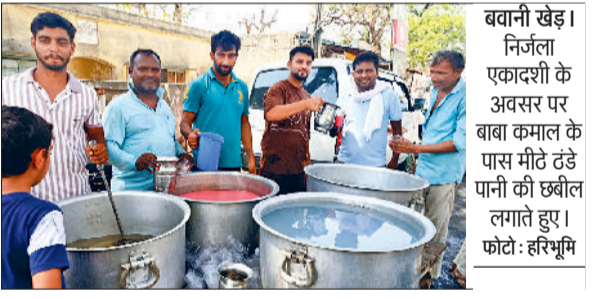
भवानी खेड़ा। निर्जला एकादशी के अवसर पर बाबा कमाज के पास मीठे ठंडे पानी की छबील लगाते हुए।