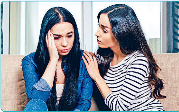
वैश्विक स्वास्थ्य खतरा तक माना जा रहा है। परिवेश में बढ़ती तपिश से आक्रामकता और हिंसक आत्महत्याओं की दर में वृद्धि होने की संभावना

इन दिनों देश के कई हिस्सों में तेज धूप और लू के थपेड़ों ने लोगों की परेशानी बढ़ा रखी है। स्वास्थ्य से जुड़ी परेशानियां हर आयुवर्ग के लोगों को घेर रही हैं। हम जानते हैं कि अत्यधिक तपिश का मौसम तन ही नहीं, मन से जुड़ी कई स्वास्थ्य समस्याएं भी साथ लाता है। बढ़ती तपिश तनाव का अहम कारण बनती है। शरीर डिहाइड्रेशन और मन थकान की शिकार से जूझता है। विशेषज्ञ भी मानते हैं कि तेज तापमान के साइड-इफेक्ट्स की सूची में मन की मायूसी भी शामिल है। गर्मियों में लोग अवसाद और अकेलेपन के भी शिकार हो जाते हैं, जिसे 'समरटाइम ब्लूज' कहा जाता है। लंबे दिन, बढ़ती गर्मी और उमस के चलते भूख न लगना, अनिद्रा और बेचैनी जैसी समस्याएं भी घेर लेती हैं। बच्चे हों या बड़े, समर फटींग या गर्मियों में होने वाली शारीरिक थकान का शिकार हो सकते हैं।